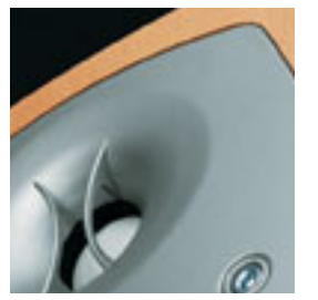
I pannelli, spessissimi e arrotondati, offrono una piattaforma rigida e stabile ai coni woofer, mentre al contempo minimizzano le diffrazioni indesiderate ai margini del baffle.

I Diaframmi a Matrice Ceramico-Metallica (CMMD), brevetto Infinity, sono in grado di rivelare tutte le sfumature della musica e delle colonne sonore, grazie alla virtuale eliminazione delle risonanze indesiderate. Il segreto di tutto ciò è in un composto ceramico chiamato Allumina. Tre volte più rigido del titanio e 85 volte più rigido della carta trattata, l'allumina viene sovrapposta ad un substrato metallico per creare un "sandwich" a tre strati. I diaframmi CMMD conferiscono ulteriore impatto in gamma bassa a ciascuno dei modelli Beta, e consentono medie ed alte frequenze aperte, dettagliate e limpide.