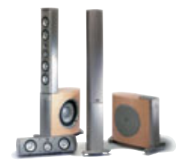
Il Prelude MTS, sistema di punta Infinity.

Le griglie metalliche perforate donano alla serie Beta un'aspetto moderno e insieme affascinante.